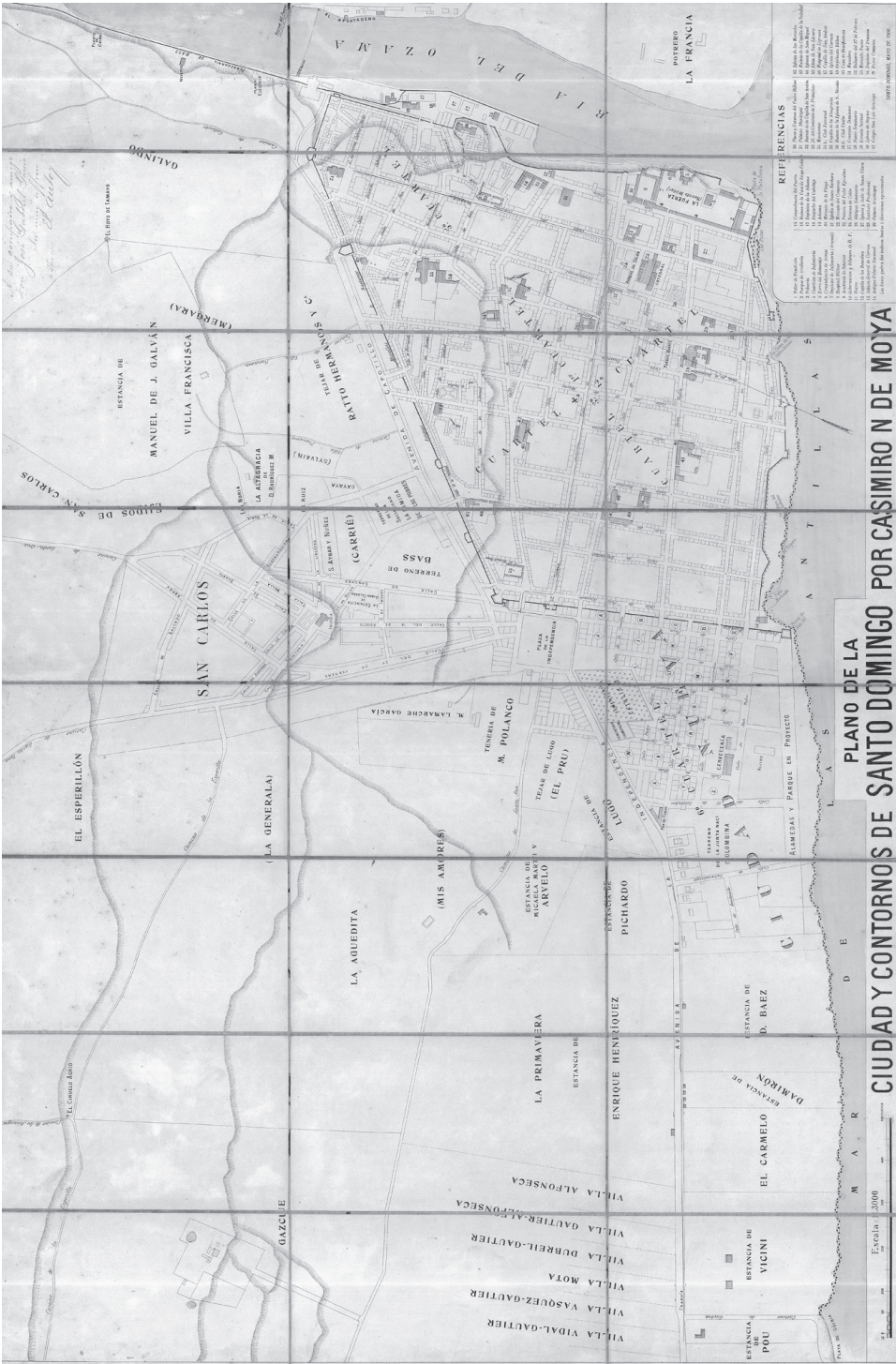
Plano de la ciudad y contornos de Santo Domingo, por Casimiro N. de Moya, mayo de 1900.